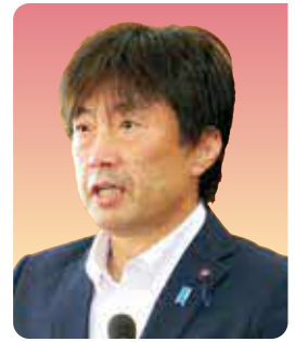
後藤 巖 議員