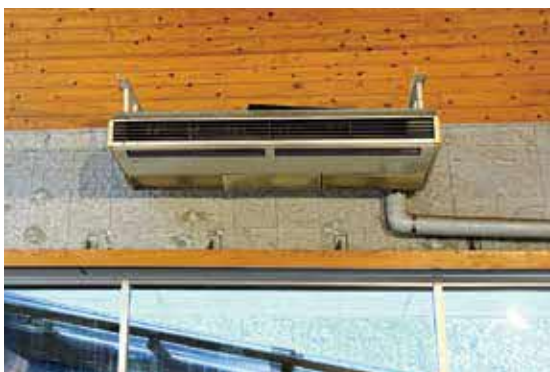
故障した奥阿蘇物産館のエアコン

【意】総合センター前の旧ワクチン接種会場内のエアコンなど活用できそうな設備は検討していただきたい。