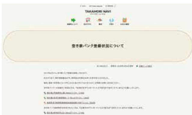
高森町の空き家バンクホームページ

移住定住というところで子育て世代向けの補助金はあるが、子育て世代に限らず空き家に特化した考え方も必要でないかと考えている。広報については、専門を置いて開設は厳しいので、他の業務に追加して事務分掌のなかで対応していきたい。