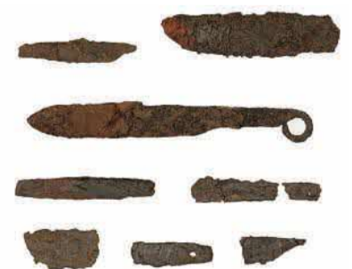
幅・津留遺跡出土刀子